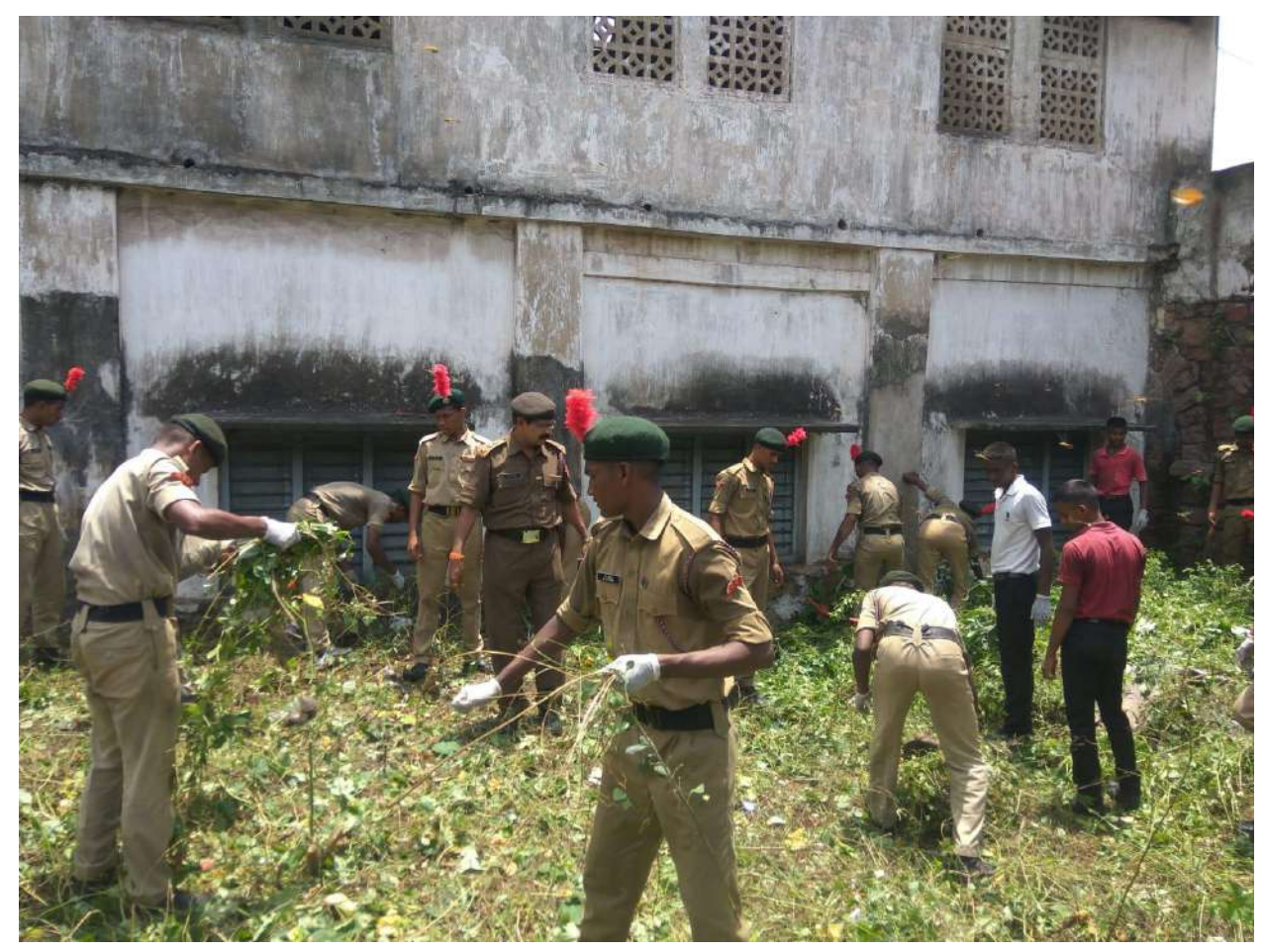
Swachha Bharta Abhiyan- Collaboration with Lions Club- Campuscleaning